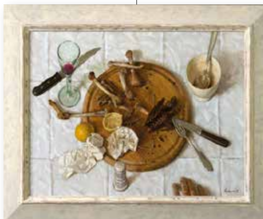
■ Kenne Gregoire - De volgende dag

woordenboek. Klein is Korf nog steeds met niet veel meer dan 50 leden. Strijdbaar en actief vind ik nu niet echt sluitende kwalificaties