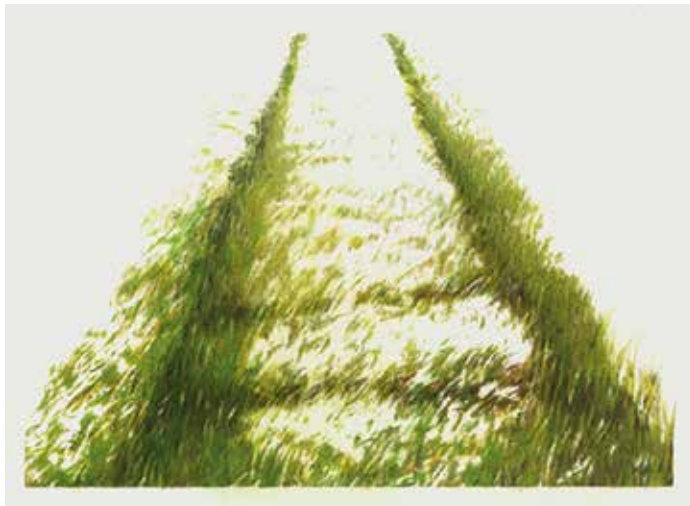
■ Piet den Hertog - Spoor in het gras (2009)

Echt dieptepunten in mijn schilders bestaan heb ik niet gehad. Wel een heel moeilijke periode in mijn leven, die zijn weerslag had op mijn werk. De tekening van het spoor in het gras (zie afbeelding) met het buiten het vlak liggende verdwijnpunt (!) is in dit verband veelzeggend. Ik herinner me dat ik me toen naar mijn werk toe moest slepen.