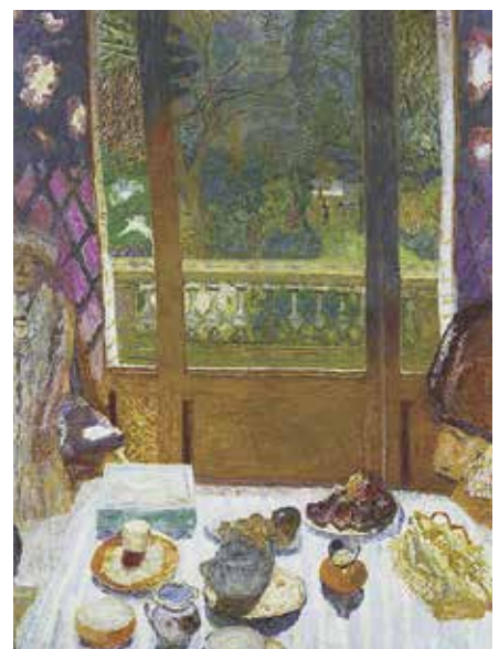
■ Pierre Bonnard - Dinning room overlooking the garden