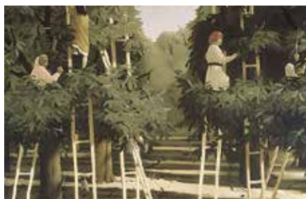
■ Pyke Koch - De oogst