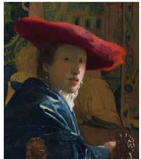
■ Johannes Vermeer: Meisje met de rode hoed

' Lichtwachershuisje op Schokland , olieverf op paneel, 68 x 20 cm, 2006. Omdat dit een plek is waar ik vroeger heel graag kwam. Helaas zijn de meeste bomen daar gekapt en is de sfeer nu helemaal weg, mijns inziens. Verder of misschien wel allereerst is het me >>