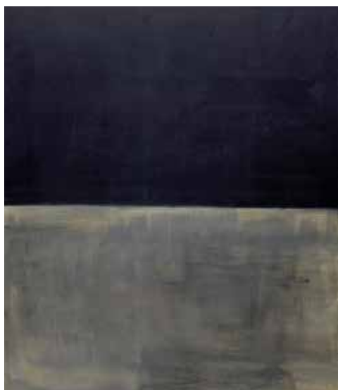
■ Mark Rothko - Black on grey

Wat weg was, werd gezien – wat aanwezig was, genegeerd. Leven moest ze, dingen scheppen, onbereikbare werelden binnengaan. ●