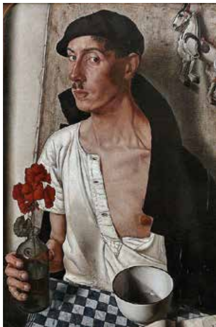
■ Dick Ket - Zelfportret

dierbaar omdat ik in de tijd dat ik dit schilderde, de genade en gunst van God ervoer, die me bij ogenblikken geheel vervulde, met name ook tijdens het werken hieraan.'