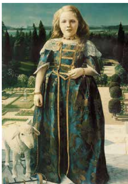
■ Carel Willink - Meisje in renaissancekostuum

Waarom kunnen de kijkers onmiddellijk zien dat het een echte 'Piet den Hertog' is?