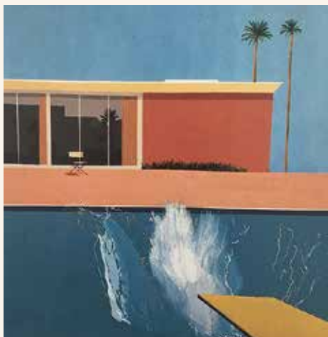
■ David Hockney - Splash

De Engelse schilder David Hockney heeft een aantal prachtige schilderijen gemaakt waarbij alleen al het spetteren en het uiteenspatten van het wateroppervlak het simpele uitgangspunt was. Wat ik zelf na de herfst met de kastanjes ga doen? De tijd zal het leren.