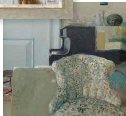
■ Matthijs Röling - Piano en fauteuil