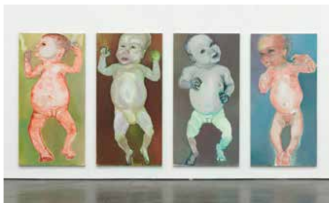
■ Marlène Dumas - The First People (I-IV) , 1991

In niets leken de vier gedochten op de plaatjes in blijde babybladen, op blijde geboortekaartjes, in blijde het-doet-pijn-bevallingsposters. Zelfs niet op haar huilende baby thuis. Ze keek haar aan. 'De vierde is rood'. (...)