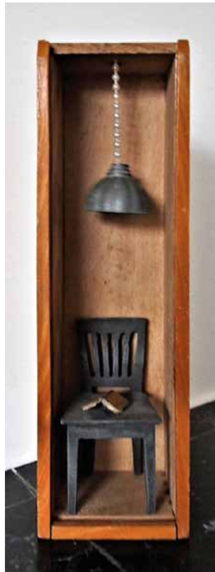
■ Leja van Gog - In het verborgene maakt Gij mij wijsheid bekend

Wat opviel was een klein intiem ruimtelijk werkje van Leja van Gog - van der Griendt, met als titel 'In het verborgene maakt Gij mij wijsheid bekend'. Het geheel was ongeveer 25 cm hoog, een nisje van hout. Dakje erop, zorgvuldig gemaakt stoeltje erin met een heel klein boekje dat er opengeslagen op lag. Klaar om verder te lezen... bovenin hing een prachtige lamp, gemaakt van tin, precies op de juiste hoogte om licht te hebben, teneinde zo weer verder te kunnen lezen. Alles heel