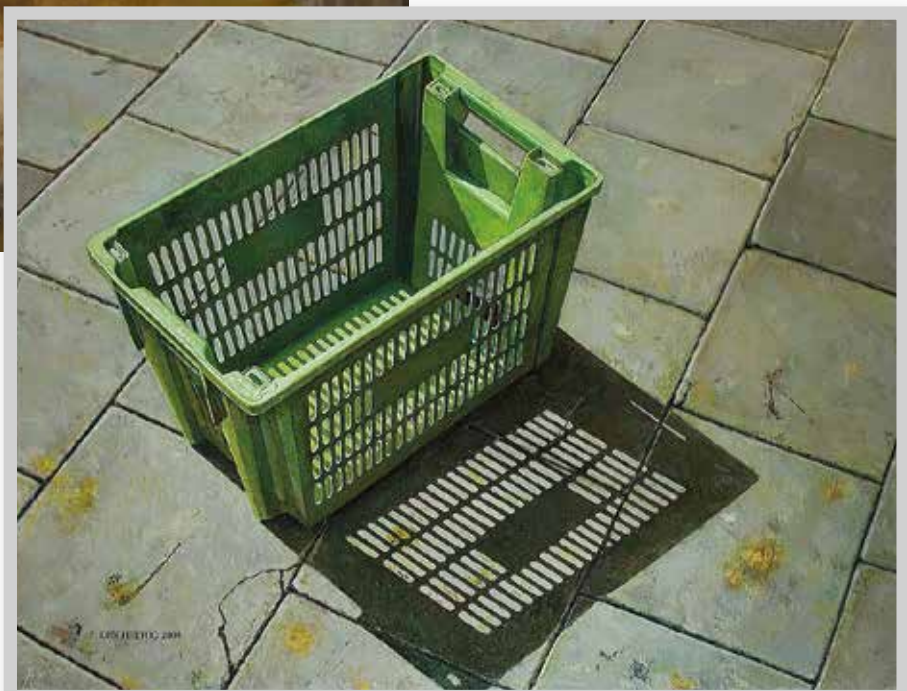
■ Piet den Hertog - Het groene kratje (2004)

'Na jarenlang havo-eindexamen tekenen gegeven te hebben aan de bovenbouw kreeg ik een groot aantal uren onderbouw op mijn bord en werden de uren voor de examenklassen gehalveerd. Dat had als gevolg dat ik veel minder gemotiveerde leerlingen kreeg. Na een jaar is me dat opgebro-