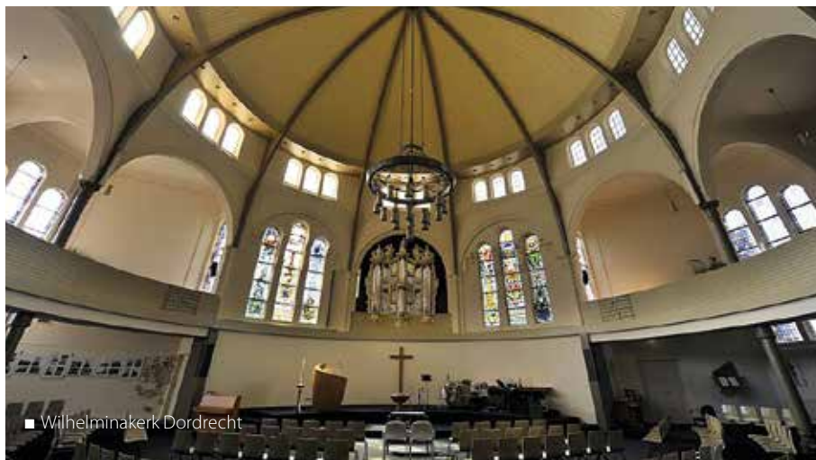
■ Wilhelminakerk Dordrecht

Inmiddels is deze rijk gevarieerde expositie alweer afgelopen. Er waren nog 40 kunstwerken, er is er nu maar één besproken. Misschien omdat het de kleinste was? Het programma loopt verder... Bij wat napluizen op internet kunt u nog vast nog veel informatie vinden. Dordrecht en de Synode staan weer even in de schijnwerpers. •