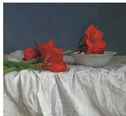
■ Jaap Roose - Amaryllis